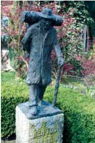
Töddensculptur, De Lutte Tödden-sculptuur, De Lutte

Erwandern Sie ein Stück Deutsch-Niederländische Geschichte: Als Verbindung der Friedensstadt Osnabrück (D) mit der Hansestadt Deventer (NL) führt der 229 km lange grenzüberschreitende Handelsweg durch abwechslungsreiche Naturlandschaften und malerische Dörfer. Auf den Spuren der „Tödden“ (Kaufleute) und „Marskramer“ (Händler) passieren Sie sehenswerte Städte wie Rheine und Bad Bentheim. Der ruhige, idyllische Streckenverlauf ist durchgehend gekennzeichnet: Auf deutscher Seite durch ein T, auf niederländischer Seite durch rot-weiße Markierung. Unter www.handelsweg.com finden Sie weitere Informationen über den traditionsreichen Fernwanderweg. Zur detaillierten Planung Ihrer Wanderung können Sie über die Münsterland Touristik ein dreiteiliges Kartenset beziehen.