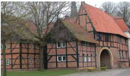
Asbeck, Hunnenporte Asbeck, Hunnenpoort