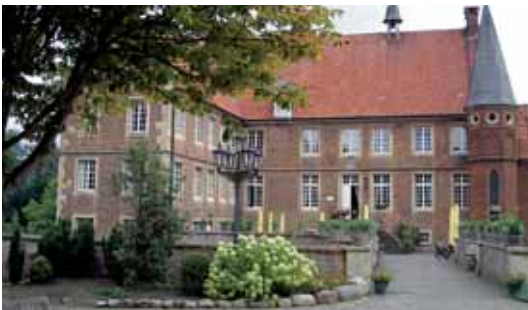
Havixbeck, Burg Hülshoff Havixbeck, Burg Hülshoff