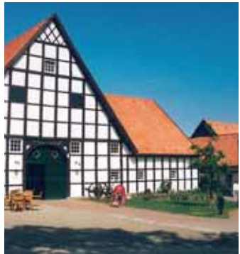
Der Schultenhof, Mettingen De Schultenhof, Mettingen