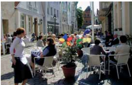
Telgte, Innenstadt Telgte, binnenstad