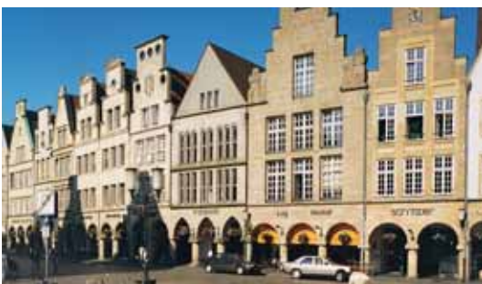
Münster, Prinzipalmarkt Münster, Prinzipalmarkt