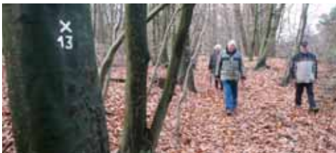
X 13 bei Hörstel