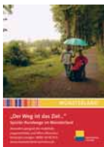
Erleben und genießen (dt./nl.) Der Weg ist das Ziel... (dt.)