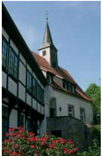
Die Stiftskirche in Leeden De Stiftskerk in Leeden