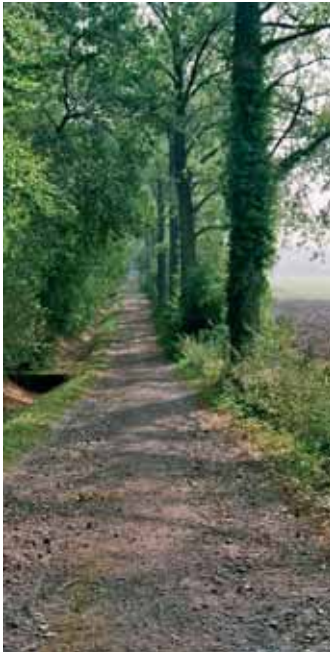
Der Horneweg bei Herbern De Horneweg bij Herbern

Nicht nur fromme Pilger folgen den neu erschlossenen Strecken, auch viele wanderfreudige und kulturell interessierte Menschen wandern auf den Spuren der Jakobspilger durch Westfalen, durch Deutschland und durch Europa.