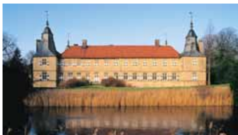
Schloss Westerwinkel Kasteel Westerwinkel

Dit pad is de aansluiting op het hoofdwandelpad 2 van de Sauerländische Gebirgsverein (SGV) van Wesel-Haltern