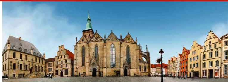
Marktplein met het stadhuis van de Westfaalse Vrede, de Marienkerk en de vakwerkhuisjes

In de buurt bevindt zich een gezellig plekje voor een korte pauze. In de Joe Enochs Sportsbar , aan het Heger Tor , heeft een voetballegende van voetbalclub VFL Osnabrück de regie in handen. Hier kan men's ochtends terecht voor