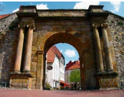
Blik door het Heger Tor in de oude binnenstad

In Osnabrück kunt u veel op één dag beleven, alles ligt immers dicht bij elkaar. Van het marktplein met het Stadhuis van de