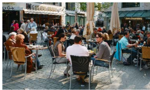
Eten, drinken en ontspannen aan het Nikolaiort