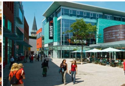
Shoppingmijl Grosse Strasse, modehuis L+T en de Kamp-Promenade

In Osnabrück kunt u niet verdwalen. Van de Johannisstrasse via de moderne Kamp-Promenade en de levendige Grosse Strasse tot aan de Krahnstrasse en het historische centrum bevindt zich één van de geliefde winkelstraten van Niedersachsen.